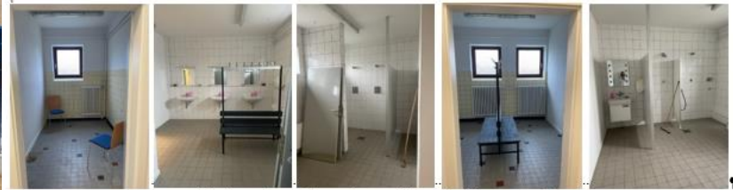
Vorhandene-Dusch- und Umkleieräume