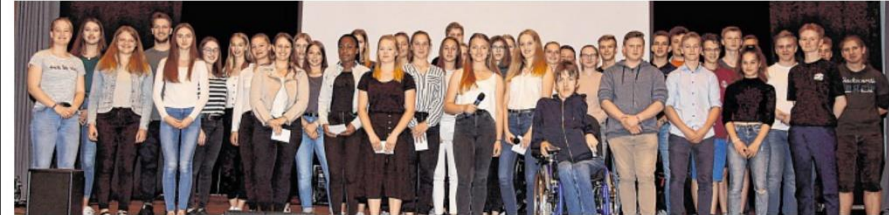
Sie stellten ihre Ideen für eine nachhaltige Zukunft an der FPS und in der Region vor: Die 44 Schülerinnen und Schüler bei der Präsentation der Ergebnisse der Projektwoche.

Projekt der AktivRegionen an der FPS: „Jugend gestaltet nachhaltige Zukunft“