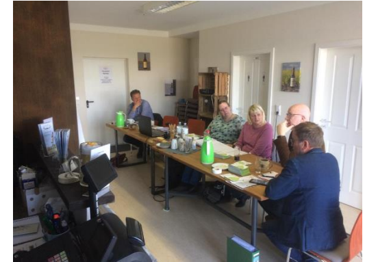
PG Gruppentreffen „Regionale Produkte“- Brauerei Niebüll