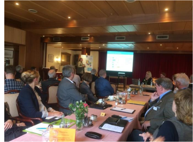
LAG-AR Beiratssitzung in Groß-Wittensee