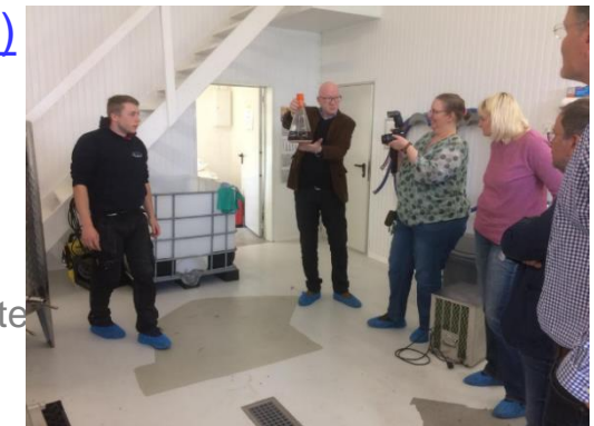
PG Gruppentreffen „Regionale Produkte“- Brauerei Niebüll