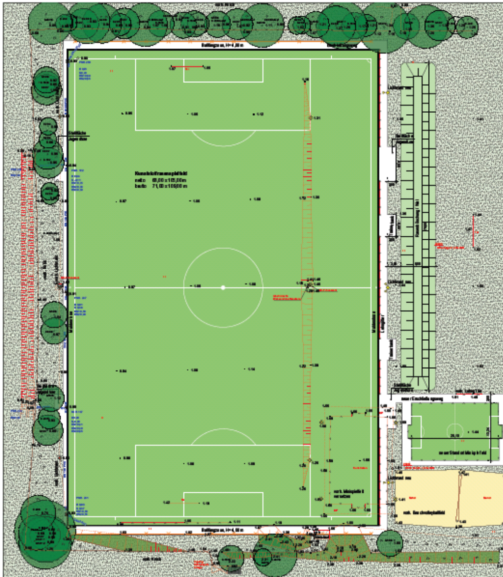
Vorplanung Kunstrasenplatz Niebüll