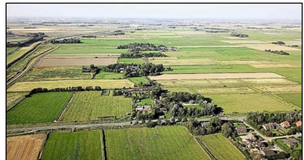
Ockholm aus der Vogelperspektive: Die Gemeinde weist zahlreiche historische Warften auf.

Projektvolumen: 59.500 € Brutto, Fördersumme: 40.000 €