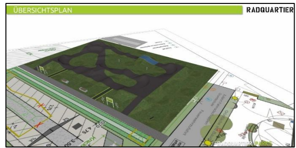
Auf ca. 2.000 m 2 Grundfläche soll der Pumptrack im Bereich der „Neuen Mitte“ in Langenhorn entstehen.

Mit der Umsetzung der Pumptrackbahn in Langenhorn folgt die Gemeinde dem Wunsch vieler Kinder und Jugendlicher, die in die Entscheidungsfindung eingebunden waren. Die Berücksichtigung dieses Wunsches ist ein großartiges Zeichen an junge Menschen, sich in Prozesse einzubringen. Mit der Bahn gewinnt die „Neue Mitte“ im Bereich um die Schule weiter an Bedeutung. Es entsteht ein Ort, der das Dorfleben bereichert, an dem Jung und Alt gemeinsam Beschäftigung finden, der Sport und Bewegung fördert, als sozialer Treffpunkt fungiert und ein attraktives Angebot für Jugendliche und junge Familien schafft.