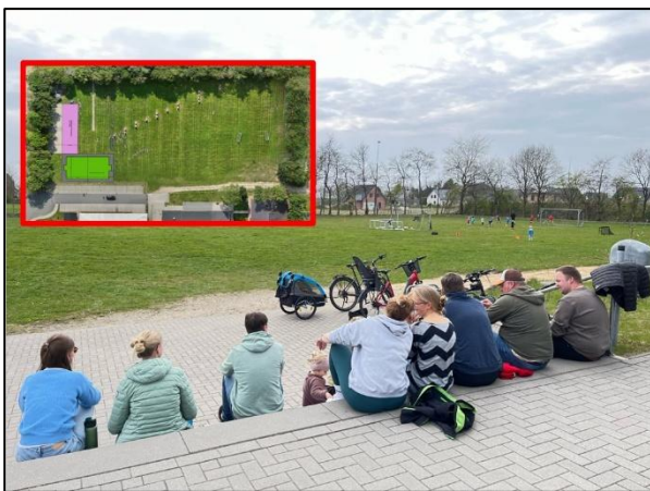
Das Multifunktionssportfeld (oben im Bild grün hervorgehoben) ergänzt den Bolzplatz und die Bogenschießanlage. Es kommt auch zur Anlage einer neuen Boulebahn (rosa im oberen Bild).

Projektvolumen: 93.504,14 €Brutto, Fördersumme: 51.073,69 €